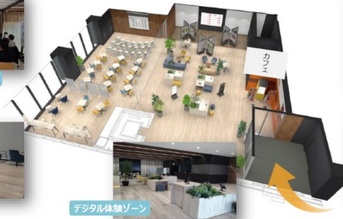
デジタル体験ゾーン