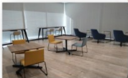
コワーキングゾーン