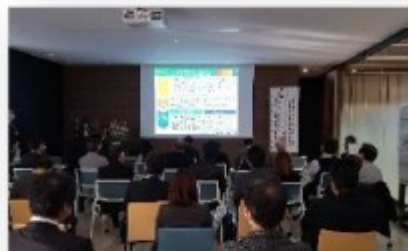
アカデミーゾーン